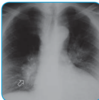
Röntgenaufnahme des Thorax

Auf dem konventionellen Röntgenbild des Brustkorbs (Thorax) war eine deutliche Vergrößerung der